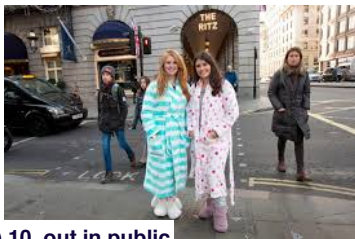
A) 10. out in public